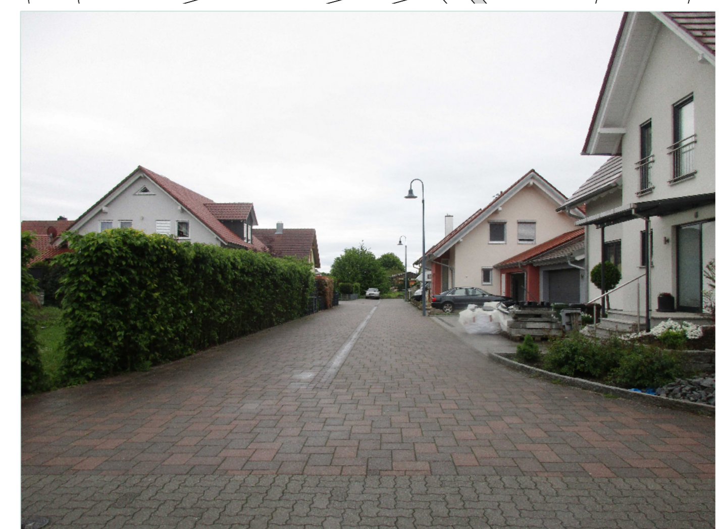
Wohnbebauung ab den 2000er Jahren