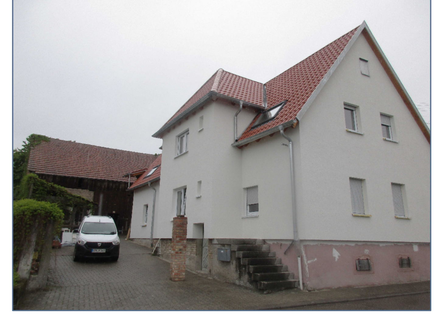
Typische Grundstücksstruktur: Haus mit Scheune