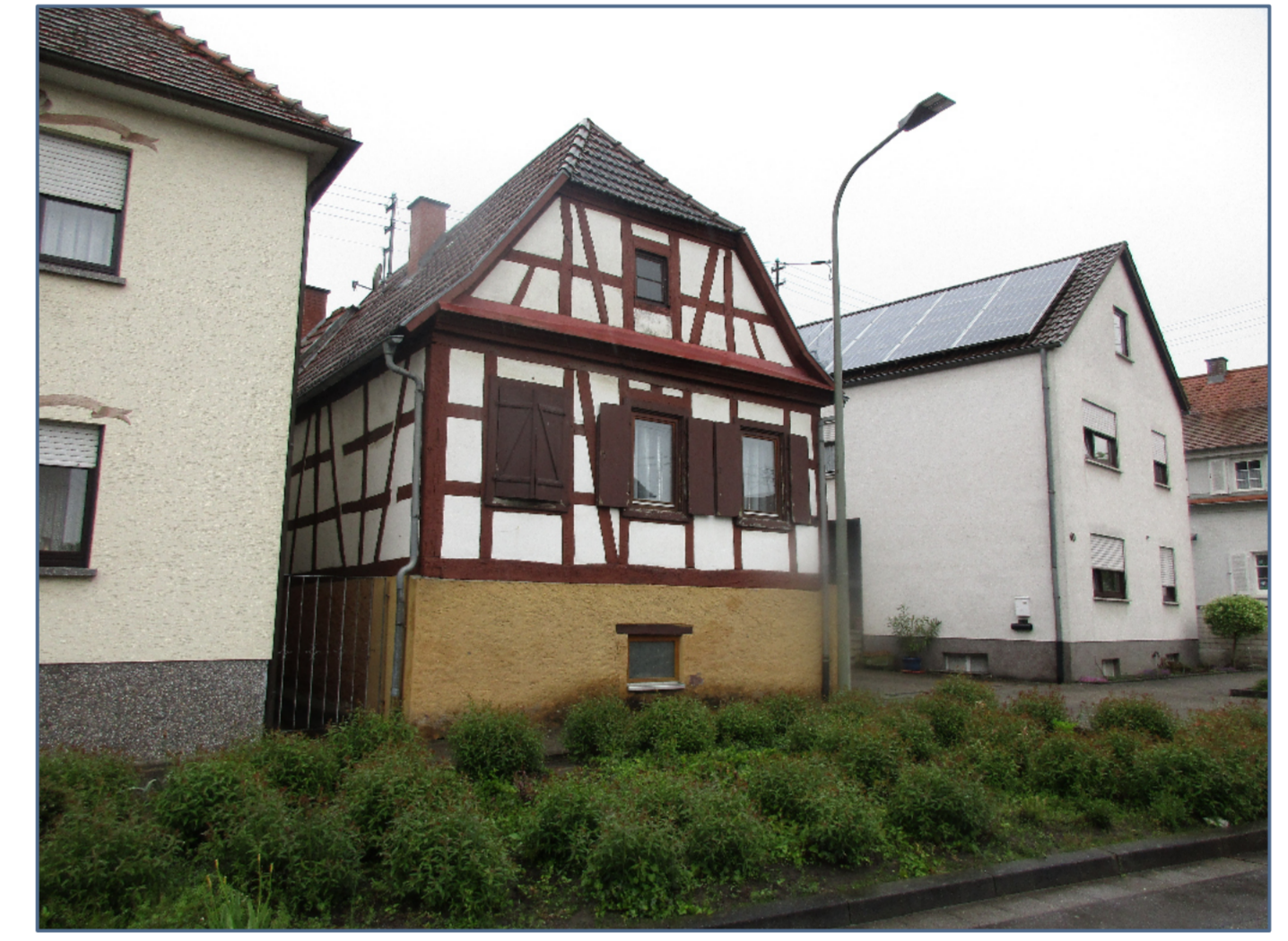
Historische Gebäude im Dorfkern