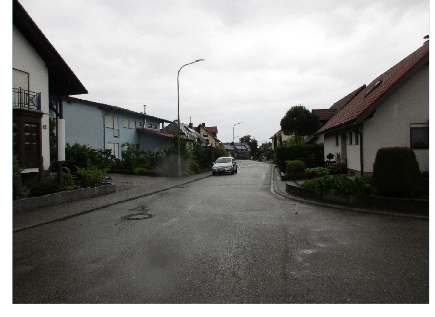
Gebäude der 70/80er Jahre